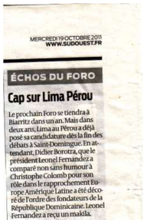
Sud Ouest-France-19 octobre 2011