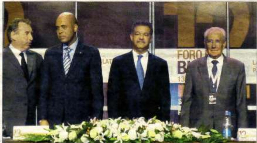
François Bayrou, Michel Martelly, président d'Haïti, Leonel Fernandez, président de la République Dominicaine, et Didier Borotra, lors de la cérémonie de clôture du 12 e Foro.

Devant l'impuissance et l'échec des politiques répressives, faut-il légaliser la drogue ? Dépenaliser ? Même si le non l'emporte, il est courageux de la part de ces décideurs d'avoir bravé le pouvoir occulte et meurtrier des cartels, en lançant ce sujet qui concerne aussi l'Europe et les États-Unis, où la drogue gangrène la société.