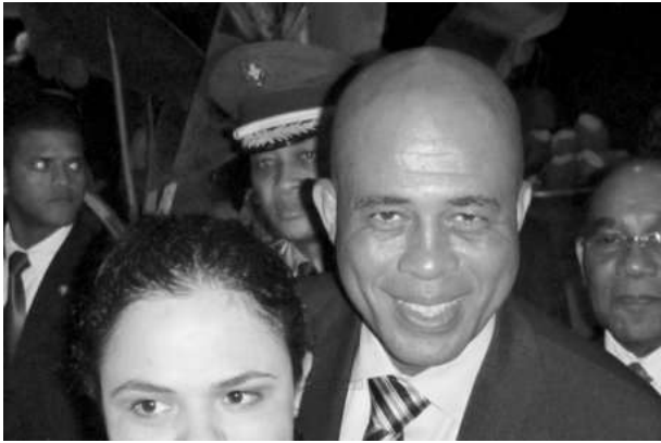
HAÏTI Vedette du 12e Foro de Biarritz, à Saint-Domingue, le président Michel Martelly a révélé ses ambitions pour le pays

Le président Martelly en compagnie d'une fan, lors de la clôture du Foro de Biarritz, à Saint-Domingue.